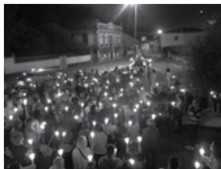
△ Procissão de Velas Paroquial, 12 de maio ▽ Procissão Corpo de Deus, Porto, 20 de junho