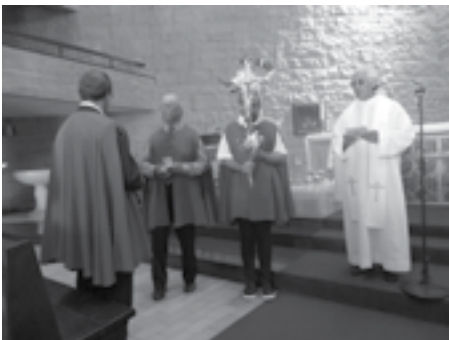
△ Visita Pascal, 21 de abril As árvores morrem de pé , pela companhia de teatro ▽ Cenas & Cenas , Igreja Sra. Porto, 15 de junho