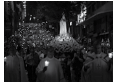
△ Procissão de Velas da cidade do Porto, 31 de maio ▽ Dia Diocesano da Família, Ovar, 16 de junho